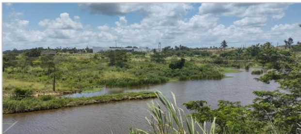
Área Livre do Terreno