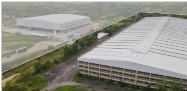
Visão Aérea 3