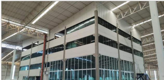
Interior da Parte Construída