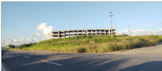
Vista da Rodovia