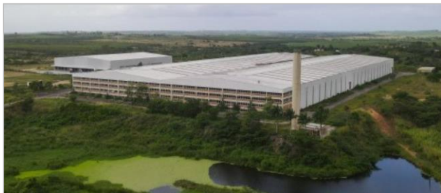
Visão Aérea 1