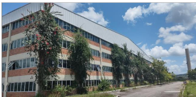
Visão da Estrutura do Galpão