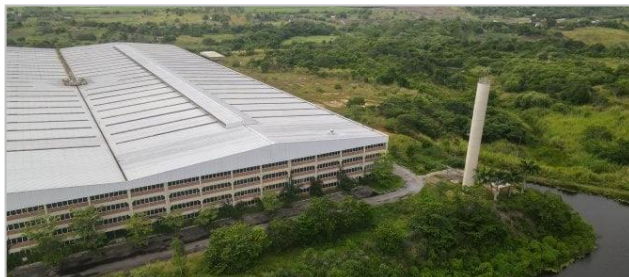
Visão Aérea 2